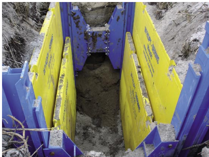
Fot. 3. Montaż płyt wewnętrznych i pogłębianie wykopu

Po zagłębieniu słupów naciskiem łyżki koparki zagłębia się stopniowo obydwie płyty. Niedopuszczalne jest wbijanie płyt.