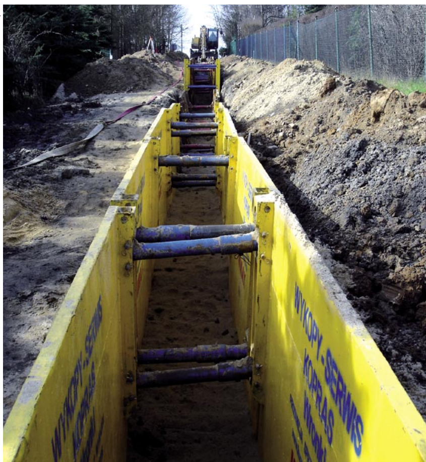
Fot. 1. Układ liniowy posadowienia boksów

Po wyciągnięciu szalunku na wysokość nadstawki, wyciągane są bolce mocujące płytę główną z nadstawką, a czynności kontynuowane są do całkowitego zasypiania wykopu.